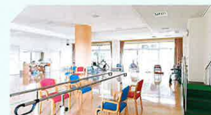
リハビリルーム（多目的ホール）